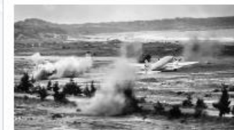
中國內戰(Chinese Civil War)(1946 - 49)

• 中國國民黨 (Chinese Nationalist Party) 及中國共產黨 (Communist Party of China) 爆發內戰。美國支援國民黨而蘇聯支援共產黨。最後共產黨勝出。