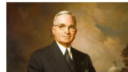
杜魯門主義 (Truman Doctrine)

• 美國總統杜魯門 (Truman) 發表演說，要求撥款四億美元支援土耳其及希臘，並表明其外交政策應為協助自由國家對抗內部少數武裝分子。